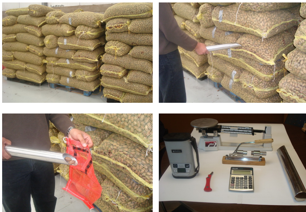
FIGURA 1.- Ejemplo para la toma de muestra.

6.2 El número de contenedores a muestrear se calcula con la siguiente fórmula: